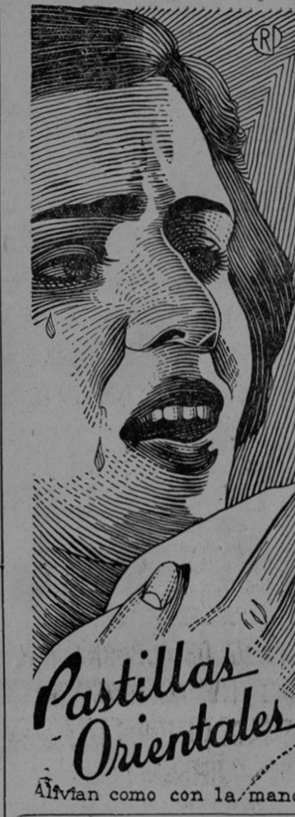
Alman como con la mano

para Pococi es una necesidad para proporcionar horas de solaz a aquel vecindario. Por todo lo cual, la Municipalidad en referencia acordó dirigirse atentamente a la diputación limonense, suplicándole se apersonara ante el Jefe del Estado o ante la Secretaría de Seguridad Pública, para gestionar la consecución del instrumental necesario para tal filarmonía, cosa que ya había sido ofrecida no hace mucho.